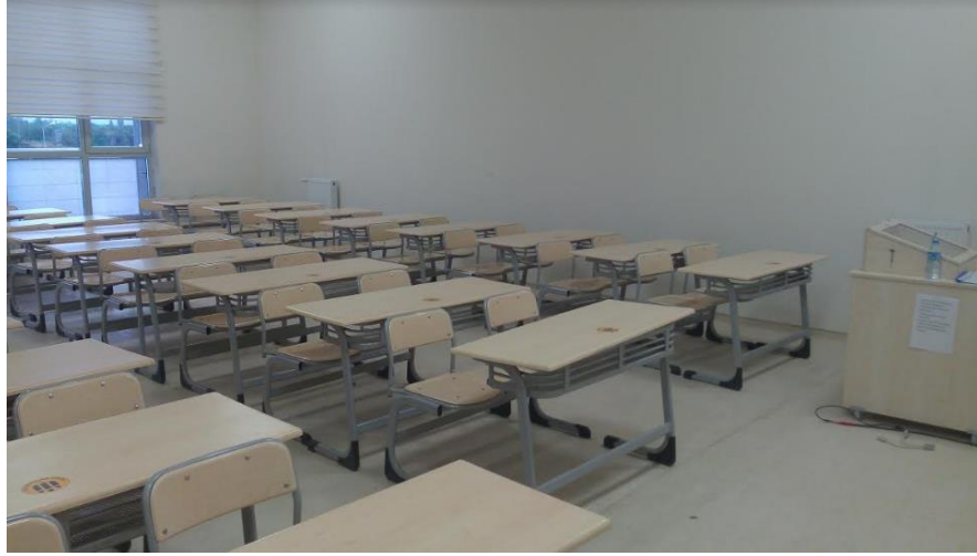
1 adet Amfi